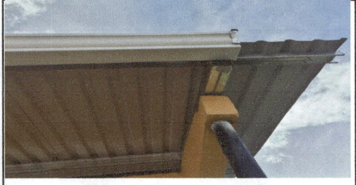
Foto 2 Sustitución de estructura de Soporte de Madera, por metal; módulo 1